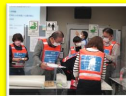
避難所設置、説明資料の準備