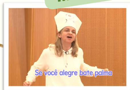
Se você alegre bate palma