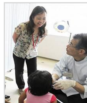
幼児健診での医療通訳

問診・診察、症状・検査結果の説明、薬の服用方法、手術の説明、入院退院の手続きなど。