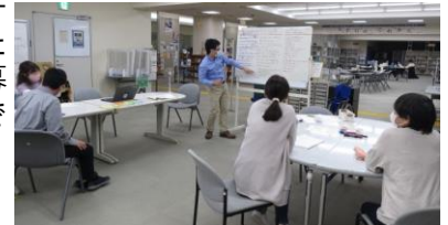
▲コーディネーター研修

令和2年度に実施した「三重県地域日本語教育コーディネーター育成研修」修了者を対象に、地域日本語教育の諸課題に対応するための知識の習得、および日本語教室の企画、立ち上げ、参加者の募集等も含めたコーディネート業務の実践を取り入れ、地域で活躍できる人材の育成を図りました。