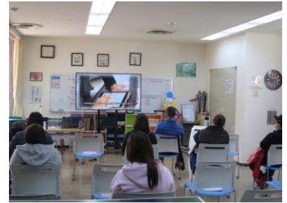
▲消費者被害防止研修会