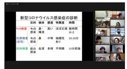
▲ 医療通訳育成研修