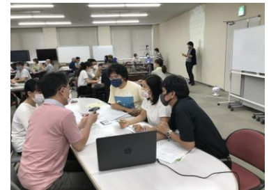
▲映画制作ワークショップ

相互理解促進のため、日本人と外国人が共に、県内で活躍する外国人住民を紹介するドキュメンタリー映画を企画・制作し、作品の上映を通じて、多文化共生に関する県民の理解の促進に努めました。