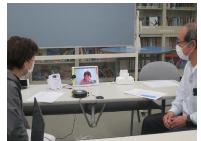
▲外国人患者対応支援セミナー

言葉・文化の違いを踏まえた外国人患者への対応方法、やさしい日本語を用いたコミュニケーション方法、未収金発生防止策やケーススタディを通じて医療現場で起こり得るトラブルの対処方法を学ぶセミナーを実施しました。