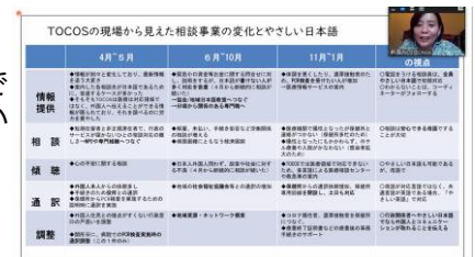
▲相談窓口対応職員向け研修会