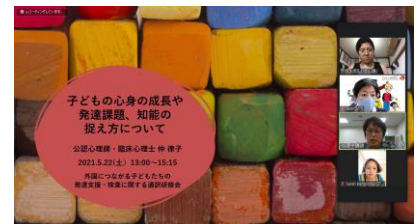
▲発達支援通訳研修会