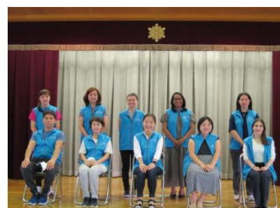
▲外国人防災リーダーズ