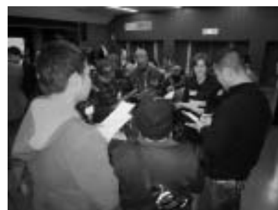
模擬避難所 巡回相談