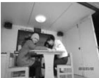
地震体験車の試乗